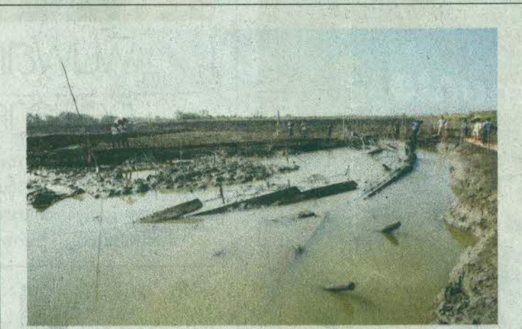
สภาพเรือโบราณพนม-สุรินทร์ บริเวณจุดพบในนาทุ่ง

พ.ศ. 2560 ชาวบ้านตั้งคำถามถึงการปล่อยทิ้ง โบราณพนม-สุรินทร์ ยุคทวารวดีที่ ต.พุน นรสิงห์ อ.เมือง จ.สมุทรสาคร โดยศอ ภรรยาเจ้าของนาทุ่งมอที่คืนให้กรมศิลป ดูแล สำนักศิลปากรที่ 1 ราชบุรีชี้แจงว่า อนุรักษ์และพัฒนาในปี 62-64 รวมถึงไ หนังสือเรื่องเรือดังกล่าวแจก 1,000 เล ไม่มีจำหน่าย ชาวบ้านบางรายจึงเรียกรือ มาแจกจ่ายในท้องถิ่นเนื่องจากต้องการ ข้อมูลนั้น (มติชน ฉบับวันศุกร์ที่ 8 ธ 2560 หน้า 12)