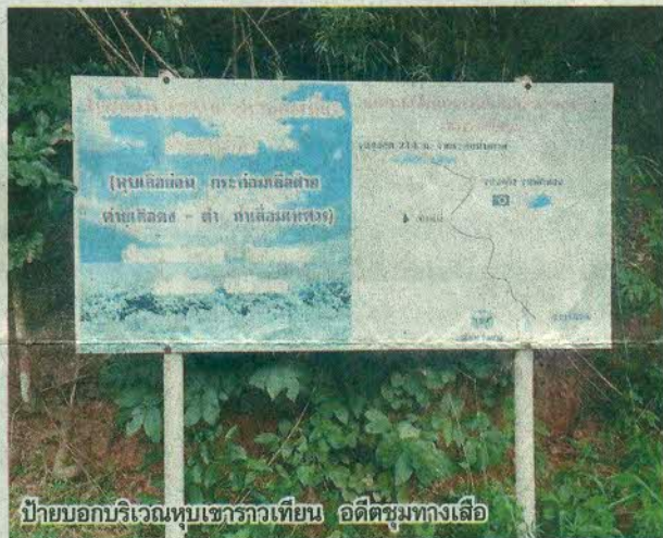
นายศรีนนท์ตายลง นัยว่ามีความอาฆาตสงฆ์ ถ้าส่งรูปไปให้เขาราวเทียนแล้วอาจจะมีเหตุถึงแก่กรรมภาพ