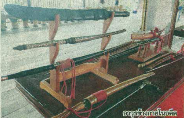
อาวุธข้างกายในอดีต