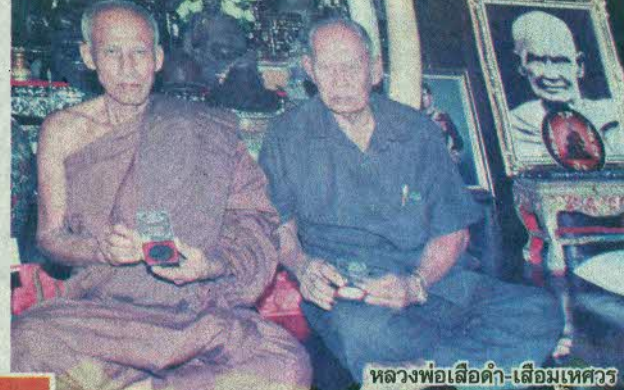
หลวงพ่อเสียดำ-เสียมเหศวร